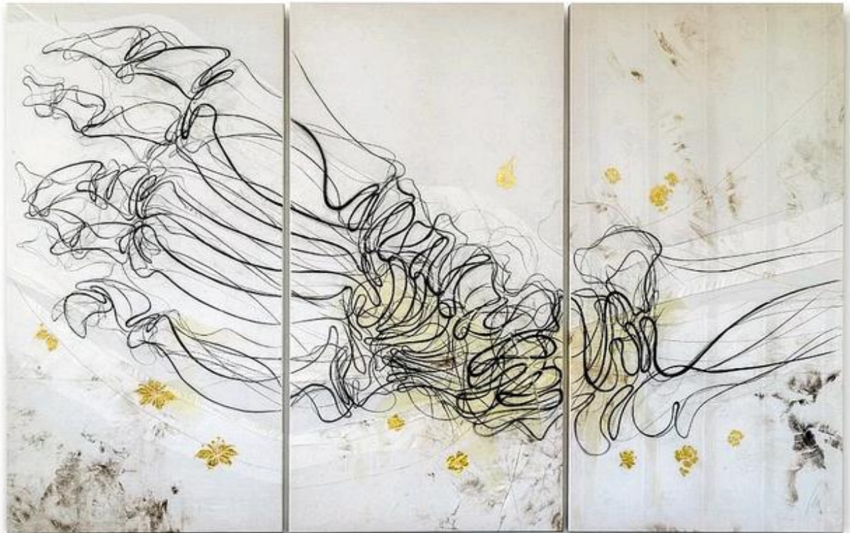
Misereor-Hungertuch 2021/2022 (Lilian Moreno Sánchez)

„Du stellst meine Füße auf weiten Raum.“